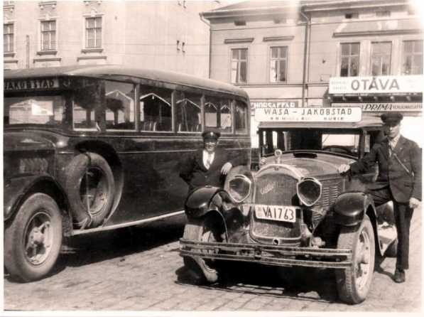
Haldin & Rose vuonna 1928

Konserniin on liitetty myös seuraavat yhtiöt: Wester Lines, Bus Wester, Järviseudun Linja, Korsholms Trafik ja Sideby Trafik. Yhtiön kaikki omistajat ovat Pohjanmaalta.