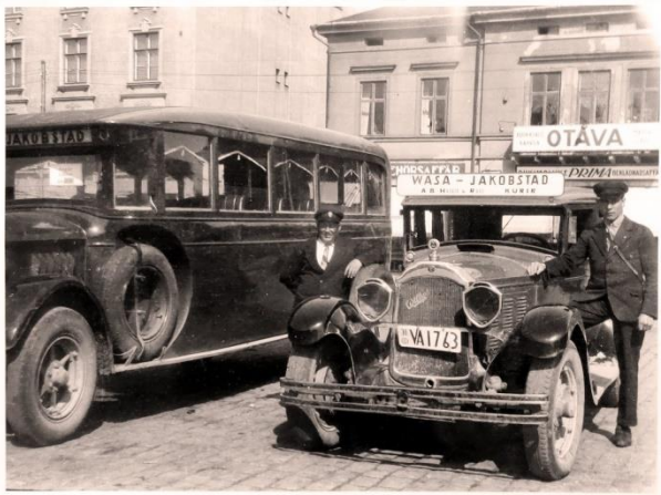
Haldin & Rose vuonna 1928

Konserniin on liitetty myös seuraavat yhtiöt: Wester Lines, Bus Wester, Järviseudun Linja, Korsholms Trafik ja Sideby Trafik. Yhtiön kaikki omistajat ovat Pohjanmaalta.